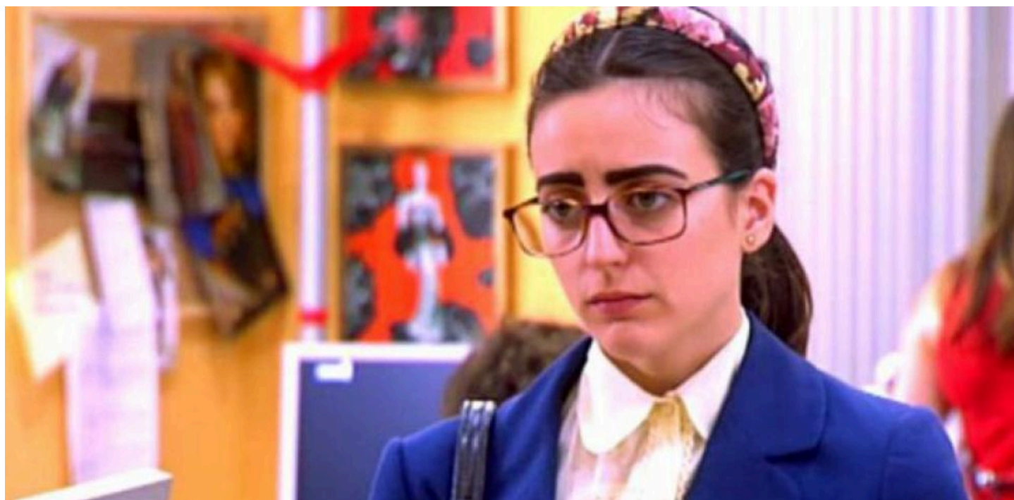
La actriz Ruth Núñez en 'Yo soy Bea' (Los 40)

La protagonista de 'Yo soy Bea' ha cambiado mucho durante estos años, pero sigue ligada a la actuación triunfando en el teatro